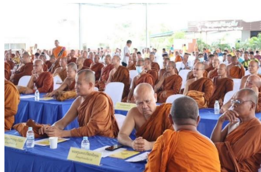
ภาพ การประชุมพระสังฆาธิการธรรมยุติกนิกาย เพื่อพัฒนาศักยภาพการปกครอง ณ วัดสุทธิธรรมาราม ตำบลนอกเมือง อำเภอเมืองสุรินทร์ จังหวัดสุรินทร์ วันที่ 17 กันยายน พ.ศ. 2568