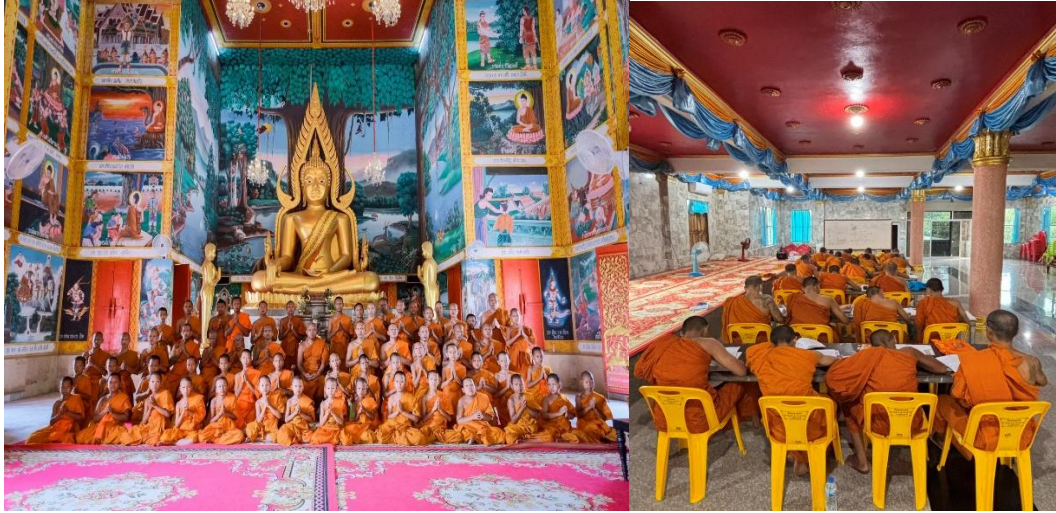
สภาพการเรียนของโรงเรียนพระปริยัติธรรม แผนกธรรม-บาลี สำนักศาสนศึกษาวัดอุทุมพร ตำบลทุ่งมน อำเภอปราสาท จังหวัดสุรินทร์